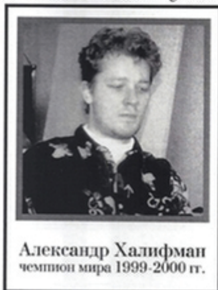
Photo signée par lui-même